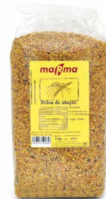
POLEN 225 grs 12 UNIDADES / CAJA REF: 20002 CÓDIGO EAN: 8436015591622