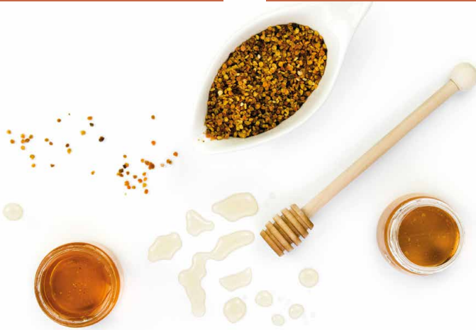
POLEN 1 kg 6 UNIDADES / CAJA REF: 20005 CÓDIGO EAN: 8436015591653